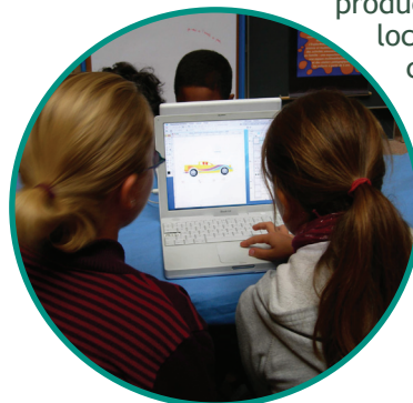
Atelier multimédia "Auto Déco"

Le but est de comprendre le parcours des marchandises alimentaires "du champs à l'assiette" : les participants monte le film du trajet d'un aliment de leur choix, depuis son pays de production jusqu'en France. Les différents moyens de transports sont également précisés. Et le bilan carbone du parcours, calculé. Une réflexion est menée sur la saisonnalité des production et l'alimentation locale. En fin de séance, chacun repart avec son film sur sa clé USB.