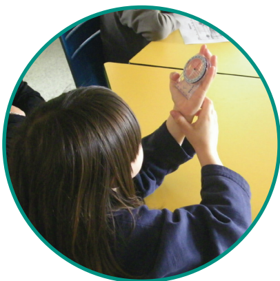
Utilisation de boussoles