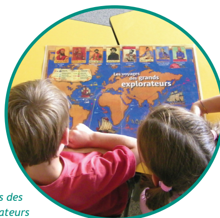
Découverte des trajets des 1ers grands navigateurs

Puis les enfants découvrent les instruments utilisés dans le passé pour la navigation (sextant, astrolabe). Ils étudient également le fonctionnement d'une boussole et apprennent à déterminer un cap à l'aide d'un compas de navigation. Cet instrument sert à déterminer la direction d'un bateau.